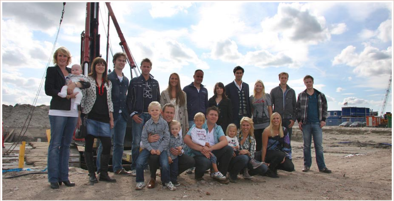
Het trotse GPO-team bij het slaan van hun eerste paal.