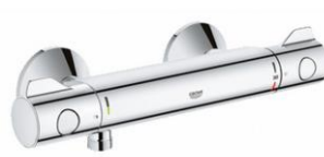
Douchekraan: Grohe Grohtherm-800