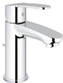
Wastafelkraan: Eurostyle Cosmopolitan