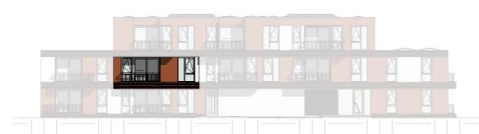
Noord - West gevel