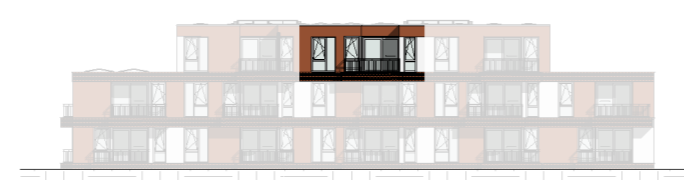
Zuid - Oost gevel