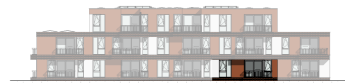
Zuid - Oost gevel