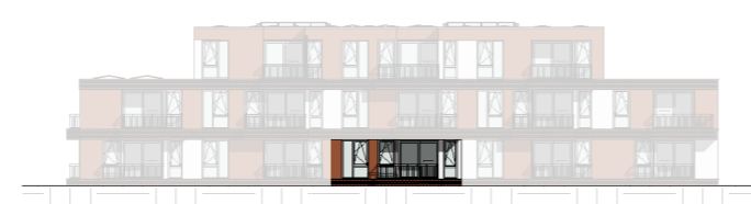
Zuid - Oost gevel