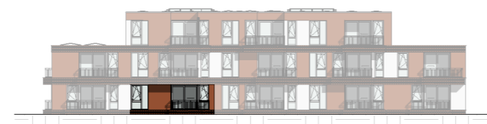
Zuid - Oost gevel