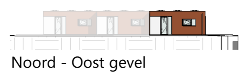
Noord - Oost gevel