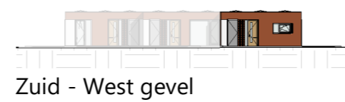
Zuid - West gevel