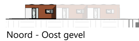
Noord - Oost gevel